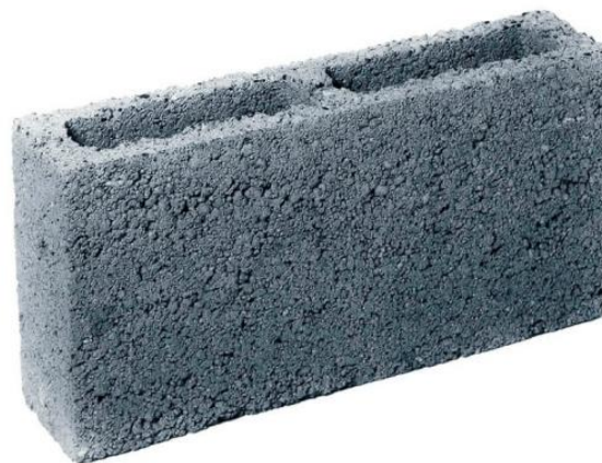
Пескоцементный блок Межстеновой