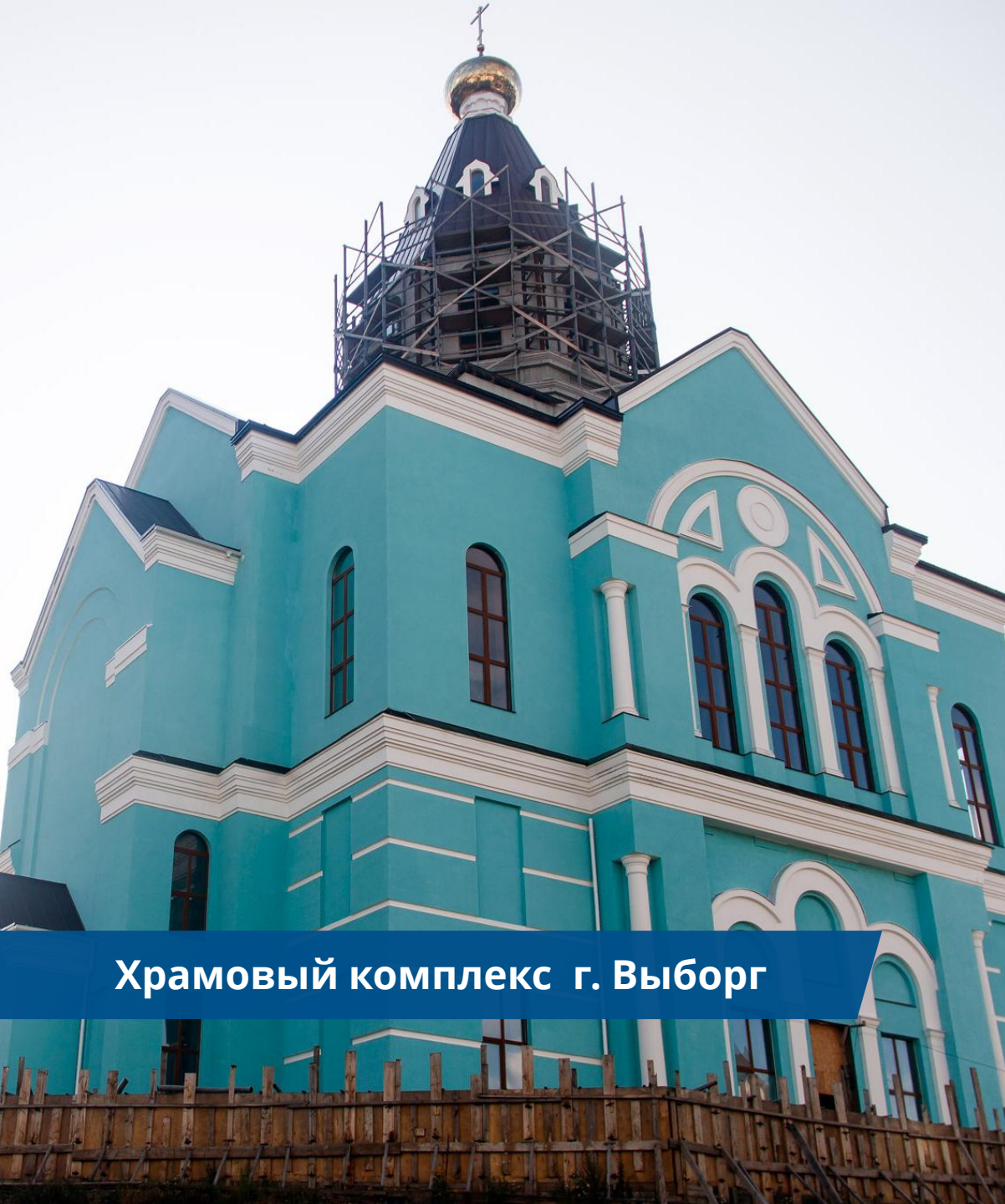
Храмовый комплекс г. Выборг