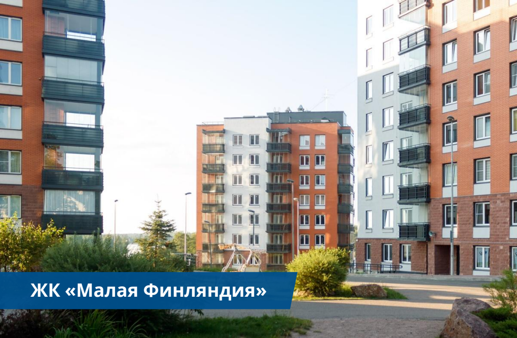
ЖК «Малая Финляндия»