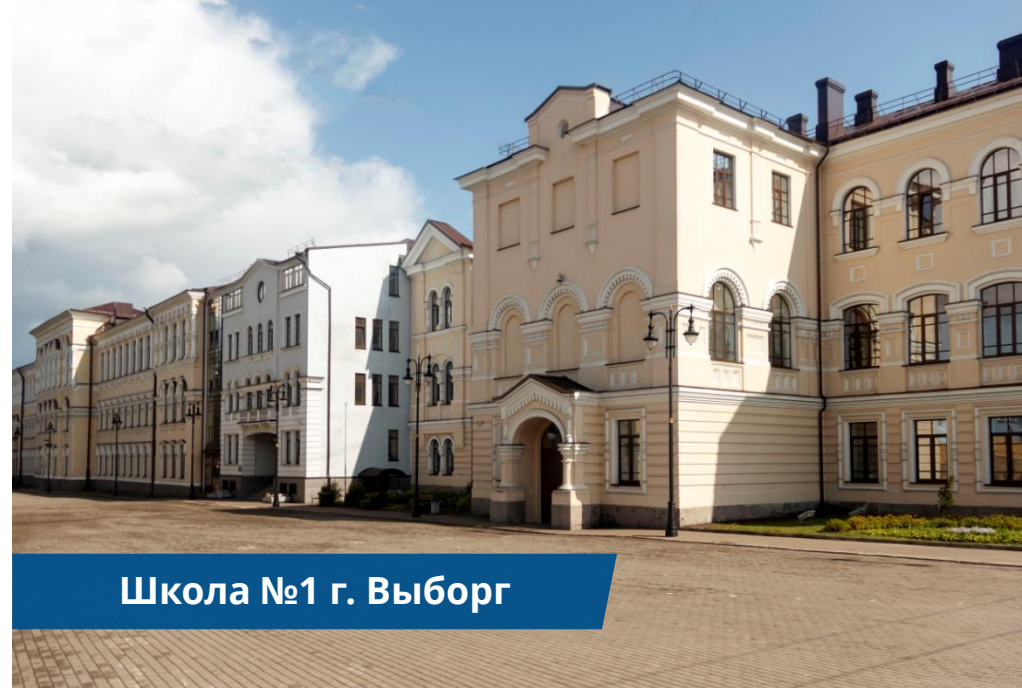
Школа №1 г. Выборг